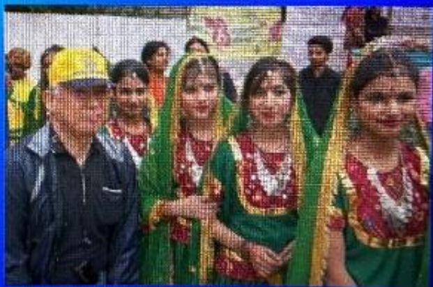
式典で民族の踊りを披露する子供達