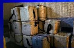
ワクチン用保冷バッグ