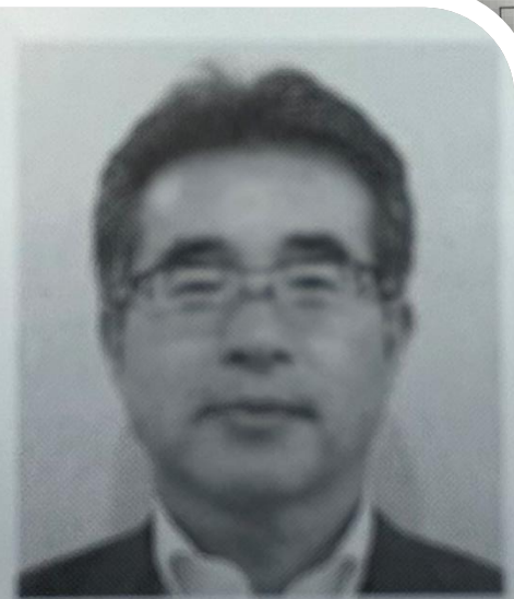
杉山 元 (すぎやま はじめ)