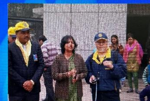
保健所医師よりご挨拶